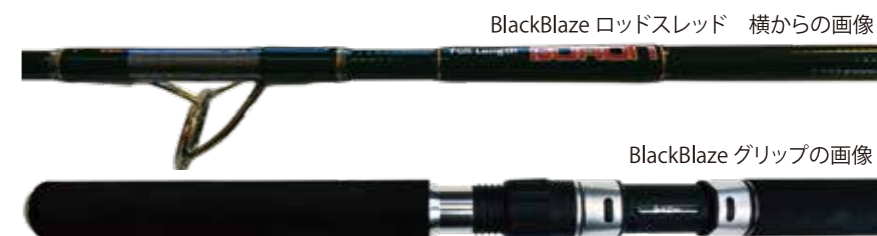
BlackBlaze ロッドスレッド 横からの画像

アングラーが求めるターゲットが大型化『ブルーブレイズ』のフルレングスポロンをダブルポロン（ダブルフルレングスポロン）に進化する事で硬さではなく粘りと耐久性を得たモデルがブラックブレイズです。粘りと耐久性を生かし近年流行の大型ルアーも対応していますのでストレスなく振り抜けます。