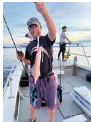
スピンングモデル